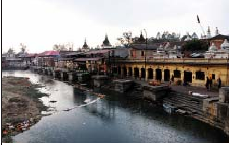
ಪಶುಪತಿನಾಥ ದೇವಾಲಯದ ಹಿಂಭಾಗದ ಸ್ಥಾನ

ಪಶುಪತಿನಾಥ ದೇವಾಲಯ ವಿಶಾಲವಾಗಿದೆ. ಪ್ರಾಂಗಣದ ನಡುಭಾಗದಲ್ಲಿ ಪ್ರಧಾನ ದೇವಾಲಯವಿದೆ. ಪಗೋಡ ಶೈಲಿಯಲ್ಲಿ ನಿರ್ಮಿಸಲ್ಪಟ್ಟಿರುವ ಇದು ಎರಡು ಮಹಲುಗಳನ್ನು ಹೊಂದಿದೆ. ಪಶುಪತಿ ಎಂದರೆ ಶಿವ. ಈ ಶಿವಮಂದಿರ ಜಗತ್ತಿನಲ್ಲೇ ಅತ್ಯಂತ ಶ್ರೇಷ್ಠವಾದ ಪುಣ್ಯಕ್ಷೇತ್ರ ಎಂಬ ಭಾವನೆ ಕಲ್ಪಿಸುವಲ್ಲಿದೆ. ಈ ಮಂದಿರಕ್ಕೆ ನಾಲ್ಕು ದಿಕ್ಕಿನಲ್ಲಿ ನಾಲ್ಕು ದ್ವಾರಗಳಿವೆ. ಇವುಗಳ ದ್ವಾರಬಾಗಿಲಿಗೆ ಬೆಳ್ಳಿ, ತಾಮ್ರದ ತಗಡುಗಳನ್ನು ಚಿತ್ರ ಬಿಡಿಸಿದ ವಿನ್ಯಾಸದಲ್ಲಿ ಅಂಟಿಸಲಾಗಿದೆ. ಪಶುಪತಿನಾಥನ ದರ್ಶನ ಮಾಡುವ ಭಕ್ತರು ಇಲ್ಲಿನ ಪ್ರಮುಖ ದ್ವಾರವಾದ ಪಶ್ಚಿಮದ ಕಡೆಯಿಂದ ಪ್ರವೇಶಿಸುತ್ತಾರೆ. ಇದು ಬಚಾರಕ್ಕೆ ಹೊಂದಿಕೊಂಡಿದೆ.