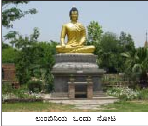
ಲುಂಬಿನಿಯ ಒಂದು ನೋಟ

ಬೌದ್ಧ ಧರ್ಮೀಯರಿಗೆ ನಾಲ್ಕು ಸ್ಥಳಗಳು ಪ್ರಮುಖವಾದವು. ಇವುಗಳನ್ನು ಬೌದ್ಧರಿಗೆ ಮುಕ್ತಿ ಕೇಂದ್ರಗಳೆಂದೇ ತಿಳಿದುಕೊಂಡಿದ್ದಾರೆ. ಇವುಗಳಲ್ಲಿ ಮೊದಲನೆಯದು ಸಿದ್ಧಾರ್ಥ ಹುಟ್ಟಿದ ಕಪಿಲವಸ್ತು. ಇದು ಈಗಿನ ನೇಪಾಳ ದೇಶದ ಲುಂಬಿನಿ ವನದಿಂದ 27 ಕಿ.ಮೀ. ದೂರದಲ್ಲಿದೆ. ಇದನ್ನು ಈಗ ತಿಲೌರಾಕೋಟ್ (Tilaurakot) ಎಂದು ಕರೆಯಲಾಗುತ್ತಿದೆ. ಇದೇ ಪ್ರಾಚೀನ ಕಪಿಲವಸ್ತುವಾಗಿದ್ದು ಬುದ್ಧನ ತಂದೆ ಶುದ್ಧೋದನ, ಆತನ ಪೂರ್ವಿಕರೆಲ್ಲರೂ ಇದೇ ಕಪಿಲವಸ್ತುವಿನಲ್ಲಿ ಹುಟ್ಟಿ ಬೆಳೆದವರು, ರಾಜ್ಯ ಕಟ್ಟಿ ಮೆರೆದವರು. ಇಲ್ಲಿ ಇಂದಿಗೂ ಶಾಕ್ಯರ ಪ್ರಾಚೀನ ಅರಮನೆಯ ಸ್ಥಳವನ್ನು ತೋರುತ್ತಾರೆ. ಇಲ್ಲಿಗೆ ಸಮೀಪದಲ್ಲಿ ಅಂದರೆ 27 ಕಿ.ಮೀ. ದೂರದಲ್ಲಿ ಲುಂಬಿನಿ ವನವಿದೆ. ಇದು