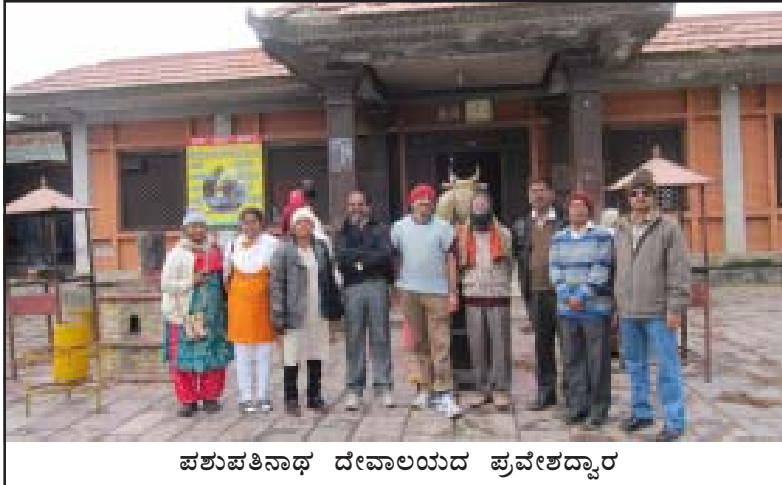
ಪಶುಪತಿನಾಥ ದೇವಾಲಯದ ಪ್ರವೇಶದ್ವಾರ

ಪಶುಪತಿನಾಥ ಮಂದಿರದ ಪಶ್ಚಿಮಭಾಗದಲ್ಲಿ ಭೈರವನ ಗುಡಿಯಿದೆ. ದೇವಾಲಯದ ಹೊರಾಂಗಣಕ್ಕೆ ಹೊಂದಿಕೊಂಡಿರುವ ಒಂದು ಪುಟ್ಟ ಮಂಟಪ. ಇಲ್ಲಿ ಬೃಹತ್ ಭೈರವನ ಮೂರ್ತಿಯನ್ನು ತಗಡಿನಲ್ಲಿ ಕಡೆದು, ಮರದ ಹಲಗೆಗೆ ಅಳವಡಿಸಿದ್ದಾರೆ. ವಿಗ್ರಹ ಭಯಾನಕವಾಗಿದ್ದು ಕರ್ನಾಟಕದ ಶಕ್ತಿದೇವತೆಗಳ 'ಸೋಮ' ಎಂಬ ಭಂಟಿನ ಮಾದರಿಯಲ್ಲಿದೆ. ಅದೇ ಬಾಯಿ, ಕೋರೆಹಲ್ಲು, ನಾಲಿಗೆ ಚಾಚಿದ ರೂಪ. ಇದನ್ನು ರೈತನ ತರಹದ ಗಂಡ-ಹೆಂಡತಿಯರಿಬ್ಬರೂ ನಿಂತು ಪೂಜೆ ಮಾಡುತ್ತಾರೆ. ನಿರ್ದಿಷ್ಟವಾದ ಪೂಜಾ ಪರಿಕರವೂ ಇಲ್ಲ. ಒಂದು ಪ್ಲಾಸ್ಟಿಕ್ ಚೀಲದಲ್ಲಿ ಹೂವು, ಭಸ್ಮ ಇಟ್ಟುಕೊಂಡಿದ್ದಾರೆ. ದೇವತೆಯ ವಿಗ್ರಹ ಮಾತ್ರ ಭೈರವನ ಆಕೃತಿ ಮೀರಿ ಭಯಾನಕವಾಗಿದೆ. ಈ ಮಂದಿರದ ಪಶ್ಚಿಮದ ಹೊರಾಂಗಣದಲ್ಲಿ ಯಜ್ಞಶಾಲೆಯಿದೆ. ಇದರಲ್ಲಿ ಒಂದು ಭಾಗ ಅಟ್ಟಣಿಕೆಯ