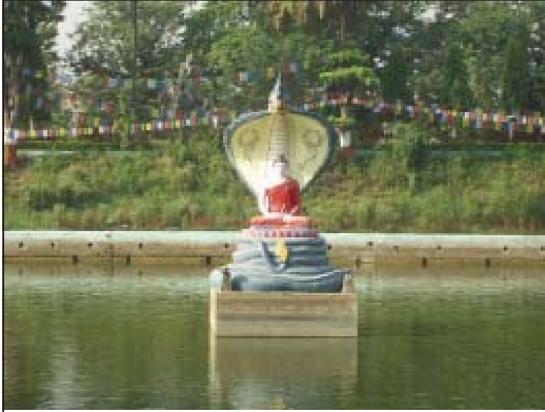
ಬುದ್ಧ ಟ್ಯಾಂಕ್ (ಗಯ)

ನಮಗೋ ಆ ವೃಕ್ಷವನ್ನು ತದೇಕಚಿತ್ತದಿಂದ ನೋಡುವ, ಅದರ ಸೊಬಗು, ತತ್ಪಾದರ್ಶಗಳನ್ನು ತುಂಬಿಕೊಳ್ಳುವ ತವಕ. ಆದರೆ ನಮ್ಮ ಗೈಡ್ ವೇಗವಾಗಿ ಬುದ್ಧ ಗಯಾದ ಪರಿಸರ, ಅಲ್ಲಿನ ದೇವಾಲಯಗಳನ್ನು, ಅವುಗಳ ಚಾರಿತ್ರಿಕ ಮಹತ್ವವನ್ನು ಬಣ್ಣಿಸುತ್ತಾ ಮುಂದೆ ಮುಂದೆ ಸಾಗುತ್ತಿದ್ದ. ಗೈಡ್ ನೀಡುತ್ತಿದ್ದ ವಿವರ, ಚರಿತ್ರೆ, ಮಾಸ್ತಿಯವರ ಯಶೋಧರ, ಪ್ರಭುಶಂಕರ ಅವರ ಅಂಗುಲೀಮಾಲ ನಾಟಕಗಳನ್ನು