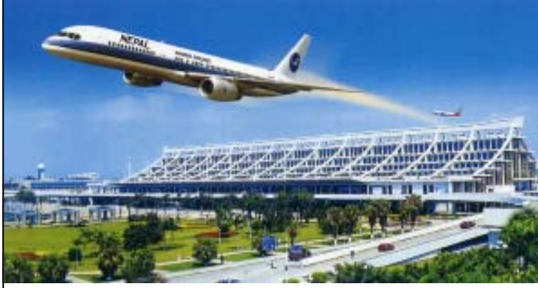
ಕಠ್ಮಂಡುವಿನ ತ್ರಿಭುವನ್ ವಿಮಾನನಿಲ್ದಾಣ

ನಿಧಾನವಾಗಿ ನೆಲ, ನೆಲದ ಮೇಲಿನ ಜನ, ಮಾನವ ನಿರ್ಮಿತ ಕಾಂಕ್ರೀಟ್ ಕಾಡು ಹಂತಹಂತವಾಗಿ ಸ್ಪಷ್ಟವಾಗತೊಡಗಿತು. ವಿಮಾನದ ವೇಗ ತೀವ್ರವಾಗಿ ತಗ್ಗಿ, ಚಕ್ರ ನೆಲಮುಟ್ಟಿ ಸ್ವಲ್ಪ ದೂರ ರೈಲಿನ ಮಾದರಿಯಲ್ಲಿ ಚಲಿಸಿ ನಿಂತುಕೊಂಡಿತು. ಗಗನ ಸಖಿ ಮತ್ತೆ ಮೆಲುದ್ವನಿಯಲ್ಲಿ 'ನಿಮ್ಮ ಪ್ರಯಾಣ ಸುಖಕರವಾದುದಕ್ಕೆ ಧನ್ಯವಾದಗಳು' ಎಂದು ಉಲಿಯುತ್ತಿದ್ದಳು.