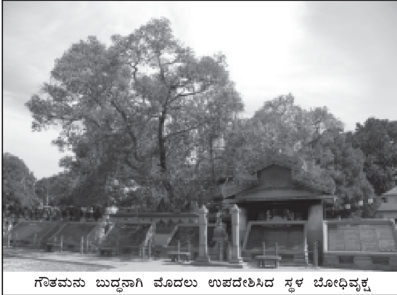
ಗೌತಮನು ಬುದ್ಧನಾಗಿ ಮೊದಲು ಉಪದೇಶಿಸಿದ ಸ್ಥಳ ಬೋಧಿವೃಕ್ಷ

ಸಾರನಾಥನ ಬಸ್ ನಿಲ್ದಾಣದಿಂದ 100 ಮೀ. ಅಂತರದಲ್ಲಿ ಬೌದ್ಧ ಮಂದಿರವಿದೆ. ಬೋಧಿವೃಕ್ಷದ ಕೆಳಗೆ ಧ್ಯಾನಾಸಕ್ತ ಬುದ್ಧ ಹಾಗೂ ಶಿಷ್ಯರಿಗೆ ಬೋಧನೆ ಮಾಡುತ್ತಿರುವ