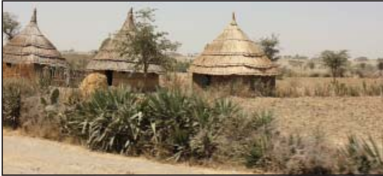
೨೪ ಹಿಮ ತಣ್ಣದ ನೇಪಾಳ

ದೂರ ಸಾಗಿದಷ್ಟೂ ಕೊನೆಗೊಳ್ಳದ ಮಂಜು ಚಿಲ್ಲಿದ ಹಾದಿಯಲ್ಲಿ ಕ್ರಮಿಸುತ್ತಿದ್ದೆವು. ಉಪ್ಪಿನ ಹರಳಿನಂತೆ ಅಥವಾ ಇಬ್ಬನಿಯ ಹನಿಯ ಮೇಲೆ ಬೀಳುವ ಎಳೆಬಿಸಿಲಿನ ತರಹವೇ ಬೆಟ್ಟ, ನದಿ, ಕಾಡು, ಮರ, ಗುಡ್ಡ, ನೀರು, ರಸ್ತೆ ಇಡೀ ಪ್ರಕೃತಿಯೇ ಕಾಣತೊಡಗಿತು. ಸತತ ಮೂರು ಗಂಟೆಯ ಪಯಣದ ನಡುವೆ ಚಲಿಸುವ ಗುಡ್ಡಗಾಡೂ ನಮ್ಮೊಂದಿಗೆ ಪಯಣಿಸುವ ಅನುಭವ. ಮಧ್ಯಮಧ್ಯೆ ಒಂದೋ ಎರಡೋ, ಇನ್ನೊಂದೆಡೆ ಹತ್ತೆಂಟು ಮನೆಗಳು. ಮನೆಗಳೆಂದರೆ ಪ್ರತಾಪದ ಕಣಿವೆಯ ಕವಲಿನ ಮನೆಗಳು, ಚೋಪಡಿ ಅಂದರೂ ಸರಿಯೇ. ಅಲ್ಲಿಯೇ ಆರೇಳು ಅಡಿಯ ಪುಟ್ಟ ಪುಟ್ಟ ಮಡಿಯ ಹೊಲ-ಗದ್ದೆಗಳು. ಅವುಗಳಲ್ಲಿ ಸಾಸಿವೆ, ಪಾಲಕ್, ಮೂಲಂಗಿ, ಸೊಪ್ಪಿನ ತರಕಾರಿ. ಇಳಿಜಾರಿನ ಹರಿಯುವ ನೀರಿನ ಒಡ್ಡುಗಳಲ್ಲಿ ಗೊನೆ ಹಿಡಿದು ಬಾಗಿರುತ್ತಿದ್ದ ಬಾಳೆಯ ಗಿಡ-ತೋಟ. ಅಲ್ಲೋ ಇಲ್ಲೋ ಕಣ್ಣಿಗೆ ಬೀಳುತ್ತಿದ್ದ ಕಿತ್ತಲೆ ಹಣ್ಣಿನ ಗಿಡ, ಇಣುಕಿ ಮಾಯವಾಗುತ್ತಿದ್ದ ಒಮ್ಮೊಮ್ಮೆ ಇದು ಒಂದು ನಿಸರ್ಗ ಸಹಜ ಕ್ರಿಯೆಯಂತೆ ಕಾಮಕೇಳಿಯಲ್ಲಿ ತೊಡಗಿರುತ್ತಿದ್ದ ಕಾಡುಕೋಳಿ, ಒಂಟಿಯಾಗಿ ಅಥವಾ ಹಿಂಡಿನೊಂದಿಗೆ ರಸ್ತೆಯುದ್ದಕ್ಕೂ ಅಡ್ಡಾಡುತ್ತಿದ್ದ ದೇಶೀ ತಳಿಯ ಕೆಂಪು ಬಾಸಿಂಗದ ಆಕರ್ಷಕ ಕೋಳಿಹುಂಬ, ಹೇಂಟೆಗಳು ಭಾರತದ ಪ್ರಕೃತಿಯ ಅವಿಭಾಜ್ಯ ಅಂಗವೆಂಬಂತೆ ವಲಸೆ ಬಂದ ಪ್ರಾಣಿಸಂಕುಲದಂತೆ ಕಾಣುತ್ತಿದ್ದವು.