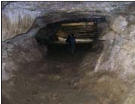
ಪೋಖ್ರಾ ಗುಹಾಂತರ ದೇವಾಲಯ

ಬಿಂದುವಾಸಿನಿ ದೇವಾಲಯ ದಿಂದ ಹೊರಟ ನಮ್ಮ ತಂಡ ಪೋಖ್ರಾದ ಕೊನೆಯ ಪಶ್ಚಿಮದ ತುದಿಯಲ್ಲಿರುವ ಮಹೇಂದ್ರ ಕೇವ್ ತಲುಪಿದೆವು. ಇದು ಹಿಮಾಲಯದ ತಪ್ಪಲಿಗೆ ಹೊಂದಿಕೊಂಡಿದೆ. 1500 ಮೀ. ಆಳದ ಗುಹೆಯ ಒಳಗೆ ಹೋಗಬೇಕು. 10 ಅಡಿಗಳಷ್ಟು ಆಳದ ಈ ಕಂದರ ಹಿಮಾಲಯದ