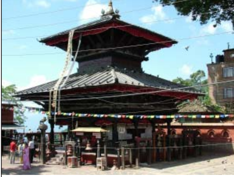
ಮನಕಾಮನ ಕಣಿವೆ ದೇಗುಲ

ದೂರ ನಡೆದು ಅಲ್ಲಿ ಎತ್ತರವಾದ ಕಣಿವೆ ಬರಿ ಮನಕಾಮನ ದೇವಾಲಯದ ಆವರಣ ತಲುಪಿದೆವು. ಬೆಟ್ಟದ ಸೋಪಾನ ಭಾಗವನ್ನು ಕಡಿದು ಮೆಟ್ಟಿಲು ನಿರ್ಮಿಸಿದ್ದಾರೆ. ಅಕ್ಕಪಕ್ಕ ಹಣ್ಣು, ತರಕಾರಿ, ಬಣ್ಣದ ವಸ್ತು, ಪೂಜಾ ಪರಿಕರ, ತಿಂಡಿ-ಊಟದ ಹೋಟೆಲ್, ಕುರಿ-ಕೋಳಿಗಳ ವ್ಯಾಪಾರ ಭರ್ಜರಿಯಾಗಿಯೇ ಇತ್ತು. ನಡುನಡುವೆ ಹಸಿರು ಹಿಡಿದ ಮರಗಳಲ್ಲಿ ಹಳದಿ ಚೆಂಡಿನಂತೆ ನೇತಾಡುತ್ತಿದ್ದ ಕಿತ್ತಲೆ ಹಣ್ಣಿನ ಗಿಡ, ಬಯಲು ಸೀಮೆಯ ನಮಗೆ ಕುತೂಹಲಕರವಾಗಿತ್ತು. ಒಂದು ಬಗೆಯ ಹೊಸ ನೋಟವೂ ಆಗಿತ್ತು.