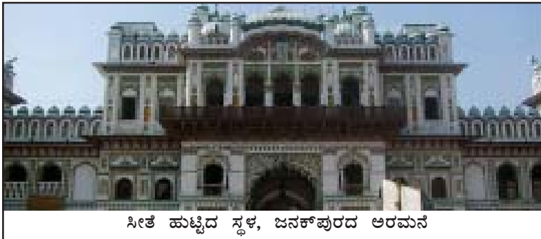
ಸೀತೆ ಹುಟ್ಟಿದ ಸ್ಥಳ, ಜನಕ್‌ಪುರದ ಅರಮನೆ

ಜನಕ್‌ಪುರ ರಾಮಾಯಣದ ಮಹಾರಾಣಿ, ಶ್ರೀರಾಮನ ಮಡದಿ ಸೀತೆಯ ತವರು. ಜನಕ ಮಹಾರಾಜನ ಅರಮನೆ ಇಲ್ಲಿದೆ. ಇದನ್ನು ಮಿಥಿಲೆ ಎಂತಲೂ ಕರೆಯಲಾಗುವುದು. ರಾಮಾಯಣದಲ್ಲಿ ಮೇಲಿಂದ ಮೇಲೆ ಮಿಥಿಲೆಯ ಉಲ್ಲೇಖಗೊಳ್ಳುವುದು ಇದೇ ಸ್ಥಳ. ಜನಕ್‌ಪುರ ತುಂಬಾ ಸುಂದರವಾದ ನಗರ. ಮಿಥಿಲೆ ಎಂದು ಇಲ್ಲಿನ ಪುರೋಹಿತರು ಕರೆಯುತ್ತಾರೆ. ಭಾರತದೊಂದಿಗೆ ಅನನ್ಯ ಗೌರವ ಇರಿಸಿಕೊಂಡಿರುವ ನಗರ. ಪ್ರವಾಸಿಗರು,