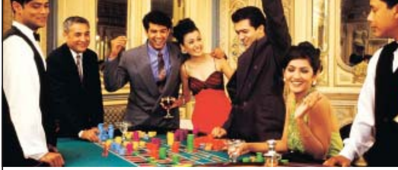
ನೇಪಾಳದ ಕ್ಯಾಸಿನೋ ಒಂದರ ನೋಟ

ಮೇಲೆ ಕೈ ಹಾಕಿ ಲಯಬದ್ಧವಾಗಿ ನೃತ್ಯದಲ್ಲಿ ತಲ್ಲೀನ. ಅದೊಂದು ಅಶ್ಲೀಲವೂ ಅಲ್ಲದ, ಅಸಹ್ಯವೂ ಅಲ್ಲದ ಮೋಹಕ ಮನರಂಜನೆ. ಬೆಂಗಳೂರು, ಕಲ್ಕತ್ತಾ ಮುಂತಾದ ಕಡೆಯ ರೆಸ್ಟೋರೆಂಟ್-ಕ್ಲಬ್‌ಗಳಲ್ಲಿ ನಡೆಯುತ್ತದೆ ಎನ್ನಲಾಗುವ ಕ್ಯಾಬರೆ ನೃತ್ಯದ ಬಗೆಗೆ ಕೇಳಿದ್ದೇನೆ. ಅದೊಂದು ಗುಂಡಿನ ಮತ್ತಿನ, ಕಾಮಕೇಳಿಯ ಪ್ರಚೋದಕ ದೃಶ್ಯಾವಳಿ. ಮಜಬೂತಾದ ಹೆಂಗಸು, ಕೆಲವು ಬಾಳೆ ದಿಂಡಿನ ತರಹದ ಚಿಲುವೆಯರೂ ಇದರಲ್ಲಿ ಸೇರಿಕೊಂಡಿರುತ್ತಾರೆ. ವೇದಿಕೆಯ ಮೇಲೆ ಬರುತ್ತಲೇ ಜಗಜಗಿಸಿರುವ ವಿದ್ಯುತ್ ಚಮತ್ಕಾರಿಕ ಆಟದಲ್ಲಿ ಇವರ ನೃತ್ಯ ರಂಜನೀಯ ಭಂಗಿಗಿಂತ ಶೃಂಗಾರ ರಸೋಲ್ಲಾಸದ ಉತ್ತೇಜನಕಾರಿ ವಾತಾವರಣ. ರಂಗಮಂಚದ ಮೇಲೆಯೇ ಮೈಮೇಲಿನ ನಿಲುವಂಗಿ ಕಳಚುವುದು, ಮೇಲುಡಿಗೆ ಬಿಚ್ಚುವುದು, ತೊಡೆ ಪೂರಾ ಕಾಣುವ ಪಾರದರ್ಶಕ ತೊಡೆಯ ಒಳಗೆ ತಮ್ಮ ಶಾರೀರಿಕ ಸೌಂದರ್ಯ ತೋರಿಸುತ್ತ ಕುಣಿತ, ಜೂಜಿನ ಗಿರಾಕಿಗಳಿಗೆ ಮತ್ತೇರಿಸುವುದು, ಅವರಿಂದ ಶಹಬಾಸ್‌ಗಿರಿ ಪಡೆಯುವುದು ಮುಖ್ಯ ಆಶಯ. ಚೊತೆಗೆ ಗಿರಾಕಿಗಳು ಋಷಿಯಿಂದ ನೋಟುಗಳನ್ನು ಚಿಮ್ಮುವುದು ಉಂಟೆಂದು ಕೇಳಿದ್ದೇನೆ. ಆದರೆ ನೇಪಾಳದ ಕ್ಯಾಸಿನೋ ಇದಕ್ಕೆ ಸಂಪೂರ್ಣ ಹೊರತು. ನಾವು ಗಮನಿಸಿದ ಒಂದು ಗಂಟೆಯ ಈ ಮನರಂಜನಾ ಕೂಟದಲ್ಲಿ ಸುಮಾರು ಆರೇಳು ಬಗೆಯ ಸಂಗೀತ, ನೃತ್ಯ ಭಂಗಿಯನ್ನು ವೀಕ್ಷಿಸಿದೆವು. ಒಂದಿನಿತೂ ಅಶ್ಲೀಲವಾಗಲಿ, ಬಟ್ಟೆ ಕಳಚುವ ದೃಶ್ಯವಾಗಲಿ ಅಶ್ಲೀಲ ಹಾಡು ಈ ಬಗೆಯ ವಾತಾವರಣ ಕಾಣಲಿಲ್ಲ. ಎಲ್ಲವೂ ಡೀಸೆಂಟ್. ಕಾರ್ಡ್ಸ್ ಆಡುತ್ತಾ ಸಂಖ್ಯೆಗೆ ಪಣ ಹೂಡುತ್ತ, ಅತ್ತ ಕಡೆಯೆ ಹೆಚ್ಚು ಗಮನ ಕೇಂದ್ರೀಕರಿಸಿದ ವಾತಾವರಣ. ಅಲ್ಲಿನ ರಸ್ತೆ, ಕುರಿ ತುಂಬುವ ಹಾಗೆ ಜನ ತುಂಬುವ ವ್ಯಾನ್ ಮಾದರಿಯ ವಾಹನ. ಬಾಯಿ ತುಂಬಾ ತಂಬಾಕು, ಗುಟ್ಟಾ ಹಾಕಿಕೊಂಡು ಕಿಟಕಿಯಿಂದ ಉಗಿವ