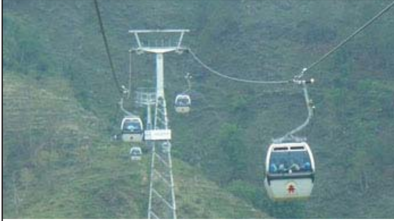
ಮನಕಾಮನ ಕಣಿವೆಯ ಕೇಬಲ್ ಕಾರ್

ಮಧ್ಯಾಹ್ನ 12.30 ರ ಸಮಯ. ಚುಮುಚುಮು ಬಿಸಿಲು, ನೆಡು ನೆತ್ತಿಯ ಮೇಲೆ ಶುಭ್ರವಾಗಿಯೇ ಕಣ್ಣು ಬಿಡುತ್ತಿತ್ತು. ಹಿಮರಾಜನ ವಕ್ರದೃಷ್ಟಿ ಕಡಿಮೆಯಾದಂತಿಲ್ಲ. ಮನಕಾಮನ ಪರಿಸರ ತುಂಬಾ ಸುಂದರವಾಗಿದೆ. ದಟ್ಟ ಗೊಂಡಾರಣ್ಯ, ಕುರುಚಲು ಕಾಡು, ಬೆಟ್ಟವನ್ನು ನಡುವೆ ಸೀಳಿ ಎರಡು ಭಾಗ ಮಾಡಿದಂತೆ ತ್ರಿಶೂಲಿ ನದಿ ಹರಿಯುತ್ತಿದೆ. ನೆಲಮಟ್ಟದಲ್ಲಿ ತುಂಬಾ ಆಳಕ್ಕಿಳಿದಂತೆ ಸುಮಾರು 250 ಮೀ. ಅಗಲವಿದೆ. ಹಿಮರಾಶಿ, ಹಿಮಕಲ್ಲುಗಳು ಕರಗಿ ನೀರಾಗಿ ಮಳೆಯ ನೀರು ಸಂಗ್ರಹಗೊಂಡು ಅಂತೂ ಸದಾ ಹರಿಯುವ ಹಾಲು ಬಿಳುಪಿನ ಜಲಧಾರೆ, ಕೆಂಪು ಕಲ್ಲುಸಕ್ಕರೆಯಂತಹ ಮರಳು, ನುಣುಪಾದ ವೈವಿಧ್ಯ ರೂಪ ತಾಳಿರುವ ಮೋಹಕ ಸಣ್ಣ ದೊಡ್ಡ ಕಲ್ಲುಗಳು, ಅದರ ನೋಟ, ಸ್ಪರ್ಶ ಎರಡೂ ಹಿತ. ತ್ರಿಶೂಲಿನದಿಯಿಂದ ಪೂರ್ವಕ್ಕೆ 1324 ಮೀ. ಎತ್ತರದಲ್ಲಿ ದಕ್ಷಿಣ ನೇಪಾಳದ ಪ್ರಸಿದ್ಧ ನಗರ ಗೂರ್ಖಾ ಜಿಲ್ಲೆ, ಇಲ್ಲಿಂದ 12 ಕಿ.ಮೀ. ದೂರದಲ್ಲಿದೆ.