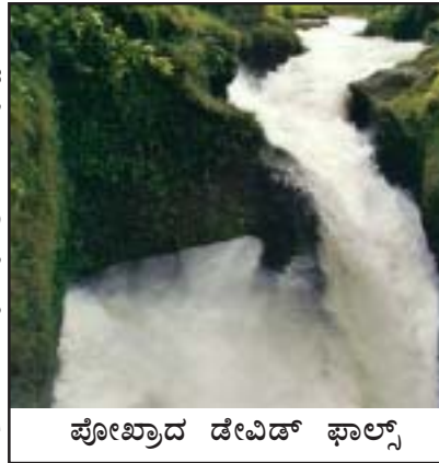
ಪೋಖ್ರಾದ ಡೇವಿಡ್ ಫಾಲ್ಸ್

ಪೋಖ್ರಾದ ಊರಂಚಿಗೆ ಹೊಂದಿ ಕೊಂಡಂತೆ ಡೇವಿಡ್ ಫಾಲ್ಸ್ ಎಂಬ ಪುಟ್ಟ ಜಲಪಾತವಿದೆ. ವಿವಾನ ನಿಲ್ದಾಣದ ಬದಿಗೇ ಬರುವ ಈ ಫಾಲ್ಸ್ ಪುಟ್ಟದು. ಒಂದು ಸಣ್ಣ ಕಾಲುವೆಯ ಅಥವಾ ಕೆರೆಯ ತೂಬನ್ನು ತೆರೆದಾಗ ರಭಸವಾಗಿ ನುಗ್ಗುವ ನೀರಿನ ಫೋರ್ಸ್ ನಂತೆಯೇ ಇಲ್ಲಿನ ಜಲಪಾತದ ಓಟ. ಶುಭ್ರವಾದ ತಿಳಿ ಹಾಲಿನಂಥ ನೀರು, ಇದನ್ನೇ ಕೃತಕವಾಗಿ