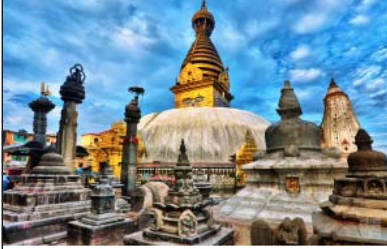
ಕಠ್ಮಂಡುವಿನ ಸ್ವಯಂಭುನಾಥ ಮಂದಿರ

ನಿಧಾನವಾಗಿ ಗೃಡ್‌ನ ಮಾರ್ಗದರ್ಶನದಲ್ಲಿ ಎಲ್ಲವನ್ನೂ ಕೇಳಿಸುತ್ತಾ ಬಂದರು.