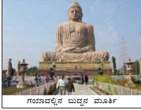
ಗಯಾದಲ್ಲಿನ ಬುದ್ಧನ ಮೂರ್ತಿ