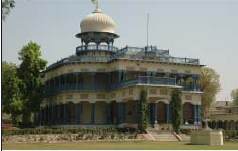
ನೆಹರೂ, ಇಂದಿರಾ ಗಾಂಧಿ ಹುಟ್ಟಿದ ಮನೆ, ಆನಂದ ಭವನ

ನೆಲೆ. ಅಲಹಾಬಾದಿನ ರುಚಿಕರವಾದ ಸೀಬೆಹಣ್ಣು ಗಳನ್ನು ತಿನ್ನುತ್ತಲೇ ಆನಂದಭವನ ಪ್ರವೇಶಿಸಿದೆವು. ಆನಂದಭವನ ಹೋಟೆಲ್ ಅಲ್ಲ. ಭಾರತದ ಮೊದಲ ಪ್ರಧಾನಿ ಜವಾಹರಲಾಲ್ ನೆಹರು ಅವರ ಮನೆ. ಅದು ಅಲಹಾಬಾದಿನ ಪ್ರವಾಸಿ ತಾಣಗಳಲ್ಲೊಂದಾಗಿದೆ. ಊರಿನ ಸ್ವಲ್ಪ ಹೊರಭಾಗದಲ್ಲಿ ಕಲ್ಕತ್ತಾ-ದೆಹಲಿ ಮುಖ್ಯ ರಸ್ತೆಗೆ ಹೊಂದಿಕೊಂಡ ಬೃಹತ್ ಮೈದಾನ, ಸುತ್ತಲೂ ಎತ್ತರವಾದ ಕಾಂಪೌಂಡ್. ಒಳಗಡೆ ವಿಶಾಲವಾದ ಮರ-ಗಿಡಗಳ ಆಲಯ. ಎಡಬದಿಗೆ ಭಾರೀ ಗಾತ್ರದ ಸೌಧ. ಇದೇ ಆನಂದ ಭವನ. ಸ್ವಾತಂತ್ರ್ಯ ಹೋರಾಟಗಾರರಾದ ಮೋತೀಲಾಲ್ ನೆಹರೂ ಕಟ್ಟಿಸಿದ ಮನೆ. ನೆಹರೂ-ಕಮಲಾ ಮದುವೆ, ಇಂದಿರಾ ಗಾಂಧಿ ಹುಟ್ಟಿದ ಮನೆ, ಫಿರೋಜ್‌ಗಾಂಧಿ-ಇಂದಿರಾ ಮದುವೆ ನಡೆದದ್ದು ಇದೇ ಮನೆಯಲ್ಲಿ. ಸಂಜಯ್ ಗಾಂಧಿ, ರಾಜೀವ್ ಗಾಂಧಿ ಹುಟ್ಟಿ ಬೆಳೆದ ಮನೆ, ಭಾರತ ರಾಷ್ಟ್ರೀಯ ಕಾಂಗ್ರೆಸ್‌ನ ಆರಂಭಿಕ ಪ್ರಧಾನ ಕಾರ್ಯಾಲಯ. ಇಲ್ಲಿ ಮಹಾತ್ಮ ಗಾಂಧೀಜಿಯವರ ವಿಶ್ರಾಂತಿ ಕೊಠಡಿ, ಮಂಚ, ಅವರು ಬಳಸುತ್ತಿದ್ದ ವಸ್ತ್ರ, ಬರವಣಿಗೆಯ ವಸ್ತುಗಳನ್ನು ಹಾಗೆಯೇ ಸಂರಕ್ಷಿಸಿ ಇಡಲಾಗಿದೆ. ನೆಹರೂ ಅವರ 'ಪ್ರವಾಸಿ ಕಂಡ ಇಂಡಿಯಾ' ಪುಸ್ತಕದ ರಚನೆ, ಅದರ ಹಸ್ತಪ್ರತಿ ಈಗಲೂ ಇಲ್ಲಿದೆ. ಮಗಳು ಪ್ರಿಯದರ್ಶಿನಿಗೆ ಬರೆದ ಪತ್ರಗಳೆಲ್ಲವೂ ಇಲ್ಲಿವೆ. ಇಂದಿರಾಗಾಂಧಿಯವರು ಹಾಕಿಕೊಳ್ಳುತ್ತಿದ್ದ ಲಂಗ, ಮೇಲುಹೊದಿಕೆ, ಬರವಣಿಗೆಗೆ ಬಳಸುತ್ತಿದ್ದ ಮೇಜು, ಪೆನ್ನು, ಬರವಣಿಗೆಯ ಸಾಮಗ್ರಿಗಳನ್ನು ಹಾಗೆಯೇ ಇಡಲಾಗಿದೆ.