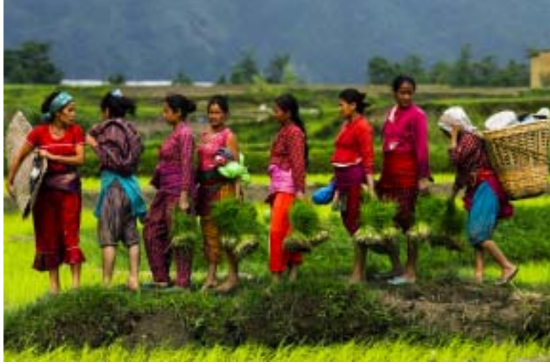
ಭಕ್ತಾಪುರದ ಕೃಷಿನಿರತ ನೀರೆಯರು