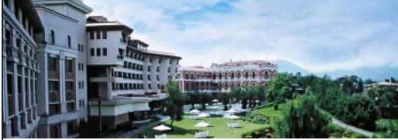
ಕಠ್ಡಂಡುವಿನ ಹೋಟೆಲ್ ಮಹಾರಾಜ ಪ್ಯಾಲೇಸ್

ಸಮಸ್ಯೆ ಕುರಿತು ಸಲ್ಲಾಪ ನಡೆಸಿ ಕೆಲಗಿನ ಭೋಜನಾಲಯದಲ್ಲಿನ ಊಟದ ಮನೆಗೆ ಬಂದರೆ ನಮ್ಮ ತಂಡದವರ ತರಾವರಿ ಅವತಾರ ನೋಡಬೇಕಿತ್ತು. ಕಾಲಿಗೆ ಸಾಕ್ಸ್, ಕೈಗೆ ಗ್ಲೋಸ್, ಸ್ಟೆಟರ್, ಟೋಪಿ, ಮೇಲೊಂದು ಶಾಲು - ಆ ಕ್ಷಣ ನಮ್ಮವರನ್ನೇ ಗುರುತಿಸುವುದು ಕಷ್ಟಕರವಾಗಿತ್ತು.